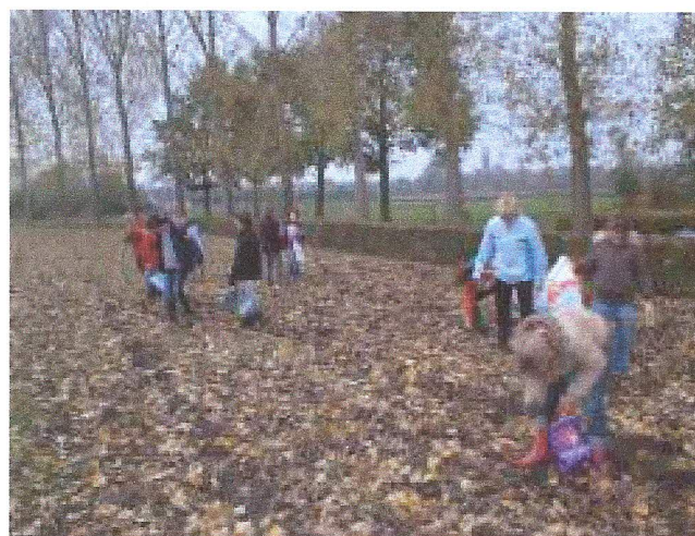
Archeologische wandeling over de akkers door leerlingen van basisschool De Oversteek enkele jaren geleden.