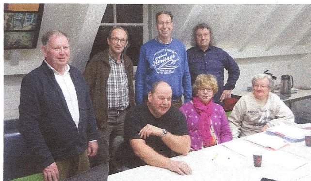
Het gekozen bestuur van EVKL

We kijken terug op een geslaagd eerste jaar en wensen jullie vanzelfsprekend een fantastisch 2020 toe.